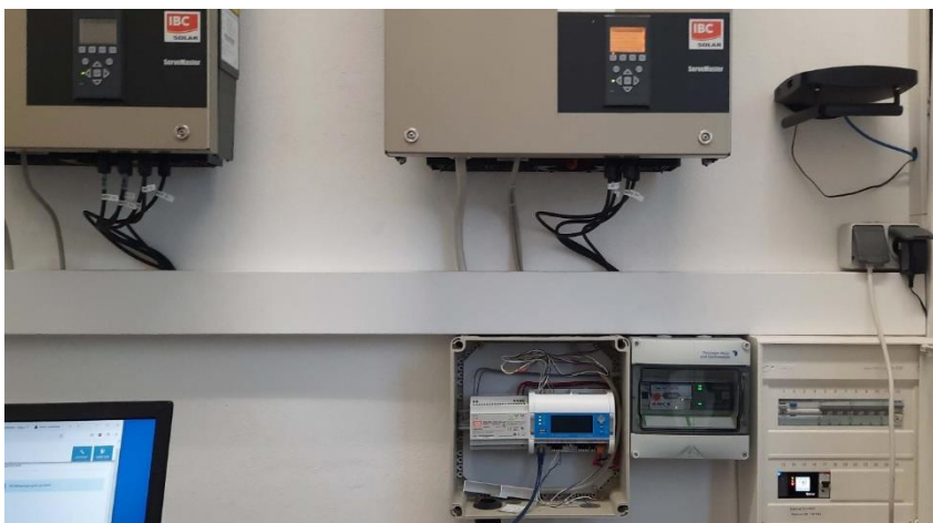
Abbildung 2: Aufbau mit der Prolan-Steuerbox im Umspannwerk Leinefelde