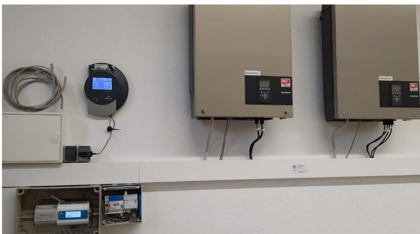
Abbildung 3: Aufbau mit der Swistec-Steuerbox im Umspannwerk Farnroda