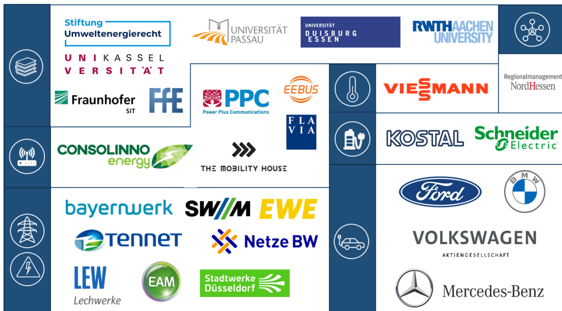
Abbildung 1: Am Projekt unIT-e 2 beteiligte Unternehmen