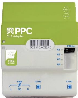
Abb. 3: CLS Adapter Submetering mit „HKE an Bord“.