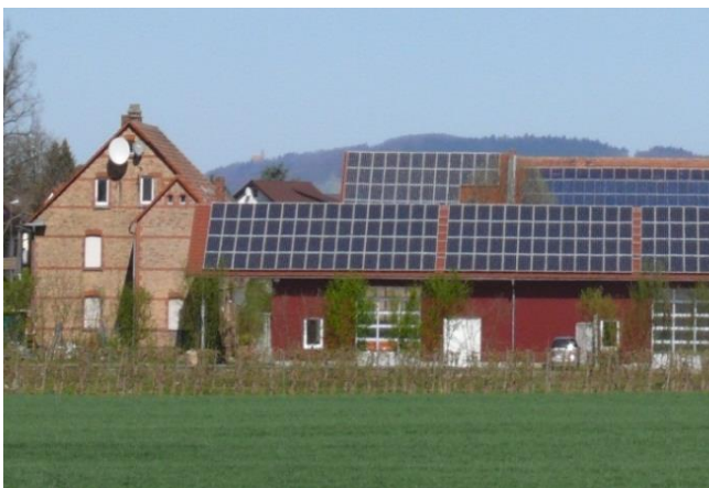
Erneuerbare Energien sichern unabhängige Versorgung für die Scilly Inseln

Die Sicherstellung einer stabilen Energieversorgung wurde so zur Herausforderung für die EVUs: Die Einbindung volatiler regenerativer Erzeuger wie PV- und Windanlagen birgt die Gefahr der Frequenzschwankungen bei zu hoher oder zu niedriger Stromerzeugung, was zu Versorgungsausfällen führen kann.